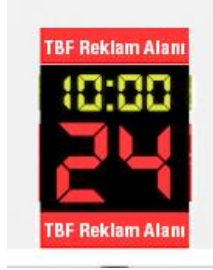
çizim - 6

ile Lig logosu ve/veya Lig partner/sponsor logosu veya reklam yer alabilecektir. Bu alanda hangi logonun veya reklamın kullanılacağı TBF tarafından kulüplere bildirilecektir.