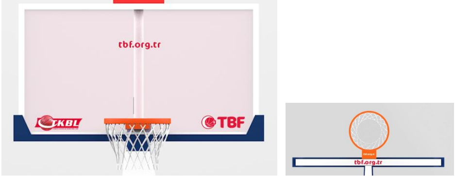
ÇİZİM - 1

köşesinde ise TBF logosu, çemberin bağlantı bölümünün üstünde ve çarpma levhası ön yüzünün üst bölümü ile tepe kameranın çekim açısına bakan kenarında “www.tbf.org.tr” yazısı yer alacaktır.