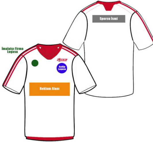
ÇİZİM - 13

83.7. Sporcuların bu yönergelere aykırı olarak başka aksesuar kullanması yasaktır.