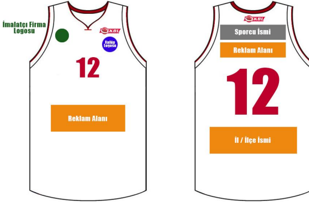
Çizim - 10