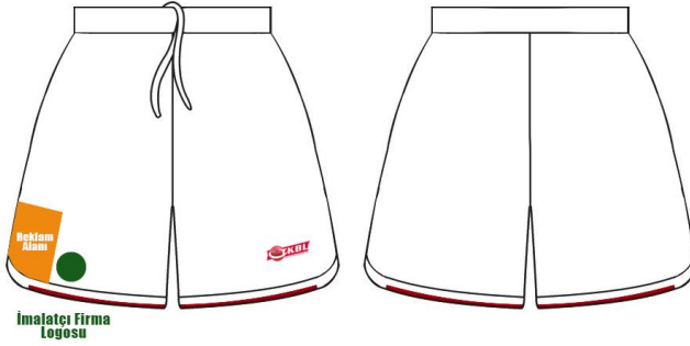
ÇİZİM - 11