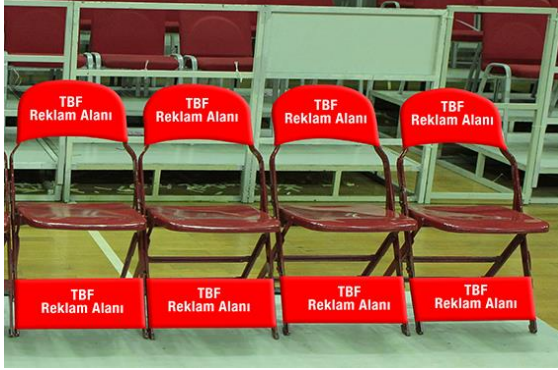
ÇİZİM - 8