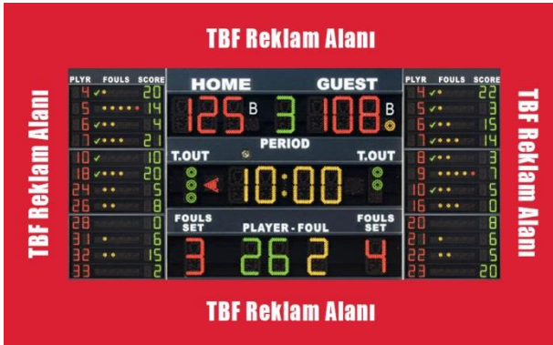
ÇİZİM - 5

Skor Gösterge Panosu'nun kenarlarında (bknz. Çizim 5) skor göstergesinin fonksiyonuna engel olmamak ve görüşü kısıtlamamak şartı ile Lig logosu ve/veya Lig partner/sponsor logosu veya reklam yer alabilecektir. Bu alanda hangi logonun veya reklamın kullanılacağı TBF tarafından kulüplere bildirilecektir.