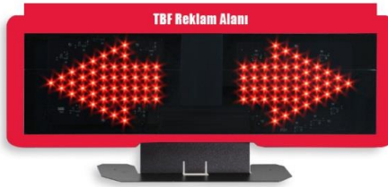
ÇİZİM - 9