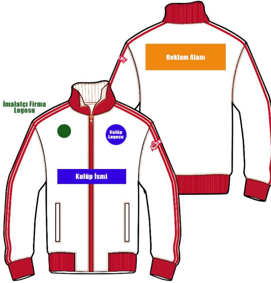
ÇİZİM - 12